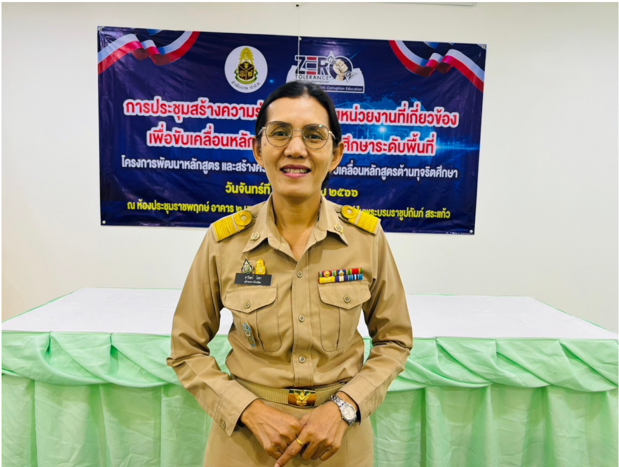
การประชุมหลักสูตรด้านทุจริต