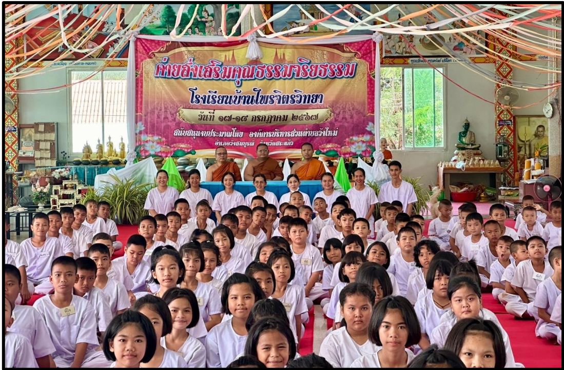
กิจกรรมสอดแทรกสาระด้านจริยธรรมแก่ ครู นักเรียนและบุคลากรทางการศึกษาในโรงเรียน