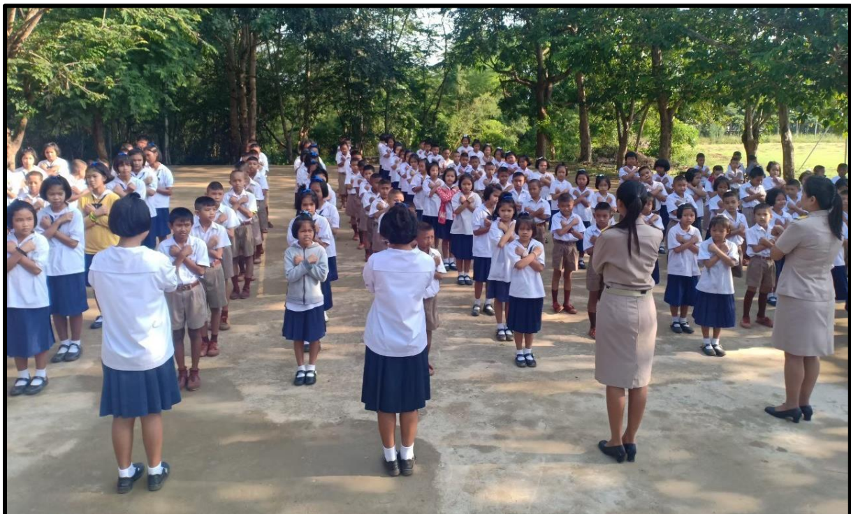
กิจกรรมการประกาศเจตนารมณ์ของโรงเรียน