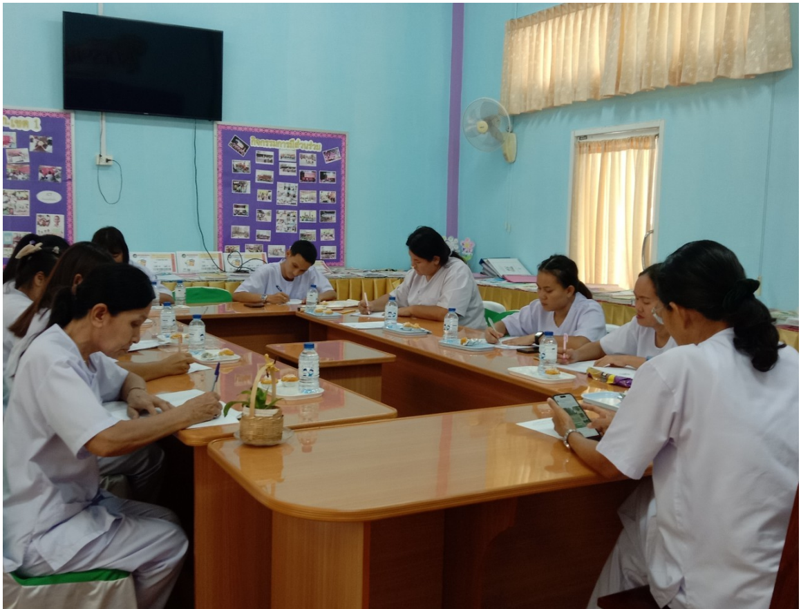
การประชุมบุคลากรภายในโรงเรียนเพื่อส่งเสริมคุณธรรมจริยธรรม